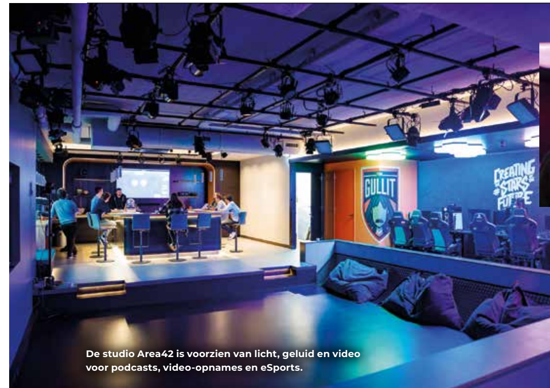
De studio Area42 is voorzien van licht, geluid en video voor podcasts, video-opnames en eSports.

"Binnenkort zal er nog meer interessant nieuws komen over ons bedrijf. Uiteraard via BM..." ●