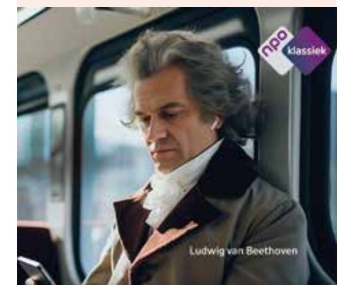
NPO Klassiek onthult waardoor Beethoven zo jong doof werd. (NPO)