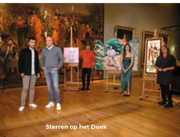
Sterren op het Doek